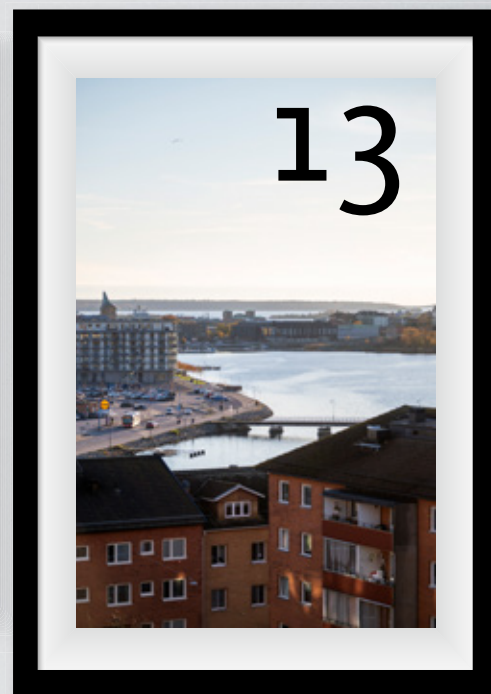
Sköna vyer från Barken